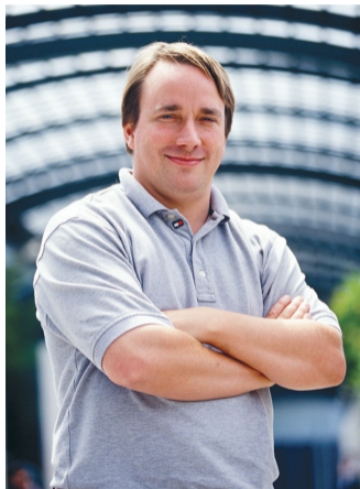
Figura 2: Linus Benedict Torvalds